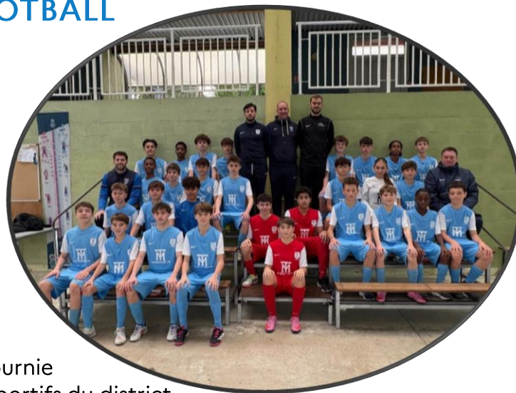
Photo fournie par le district de foot du Loir-et-Cher

Les élèves bénéficient d'une tenue complète fournie par le district et sont encadrés par les coaches sportifs du district.