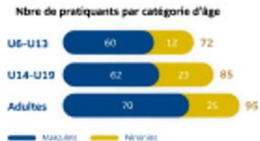
Répartition publics Masculins / Féminins